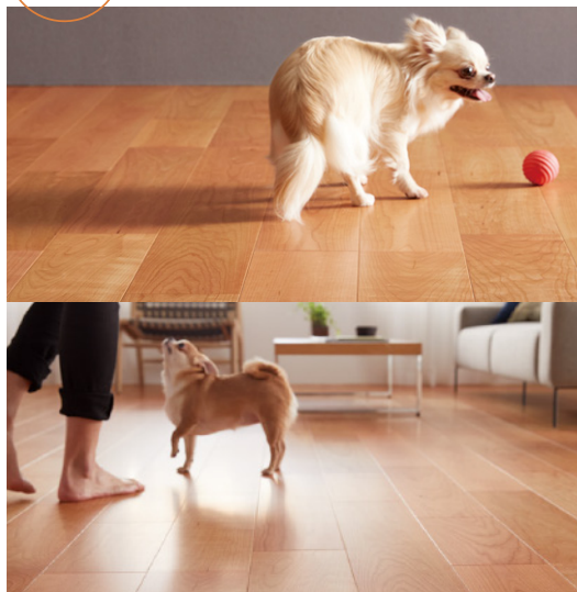
《住宅に合わせた4種類のラインナップ》