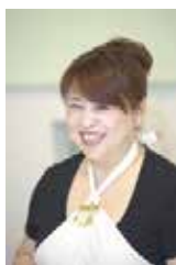
Makoの 今月のごちそうさま レシピ 第165回