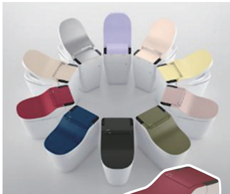
全自動おそうじトイレ「新型アラウーノ」 紅殻色(べんがらいろ)