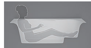
斜め形状の アームレストと フットレスト

バスタブは、リクライニングチェアとサイドテーブルのような使い心地を目指した設計で、全身浴も半身浴も、長時間リラックスして楽しんでいただけます。