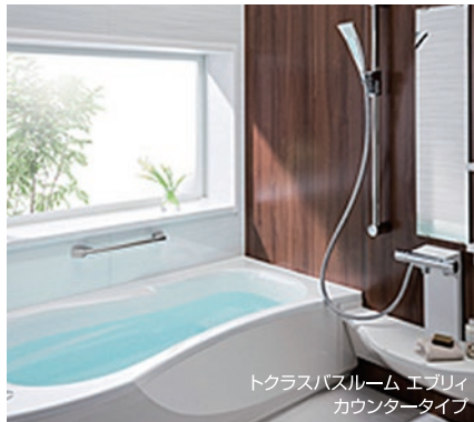
トクラスバスルーム エブリイ カウンタータイプ

近年、入浴時間や入浴スタイルが多様化しています。例えば全身浴や、半身浴で入る方など、1つの家族内でも入浴スタイルは様々。